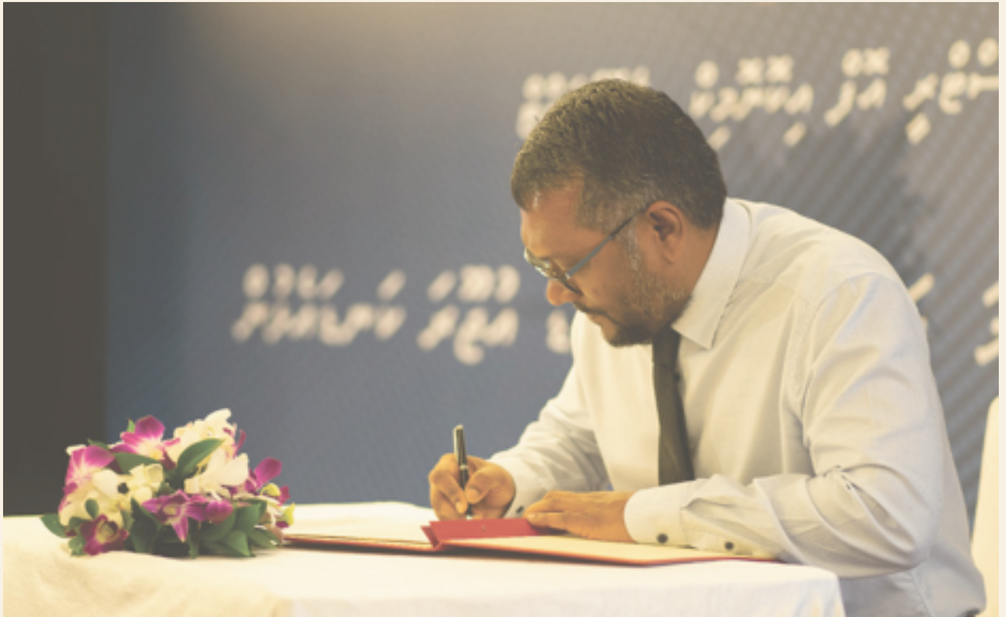
چیسریو کالیج ناسیونل یونیورسٹی آف ایڈمنسٹریشن، چیسریو