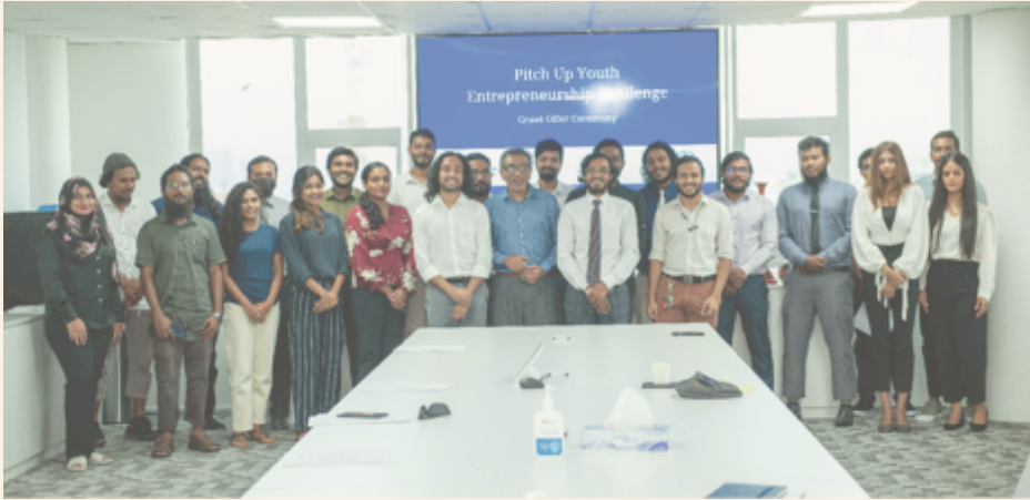
چیمپئنز اور اسٹیوڈنٹس جو انٹیورنیشنل پیتچ اپ چیلنج میں حصہ لے رہے ہیں۔

یہ چیلنج 2023 میں منعقد کیا گیا اور اس میں 150 سے زائد طلبہ نے حصہ لیا۔ اس کے ذریعے ان کی کاروباری صلاحیتوں کو جانچا گیا اور ان کو کاروبار کرنے کی صلاحیتیں فراہم کی گئیں۔ اس کے علاوہ ان کو کاروبار کرنے میں مددگار بننے والے افراد سے ملنے کا موقع بھی ملا۔