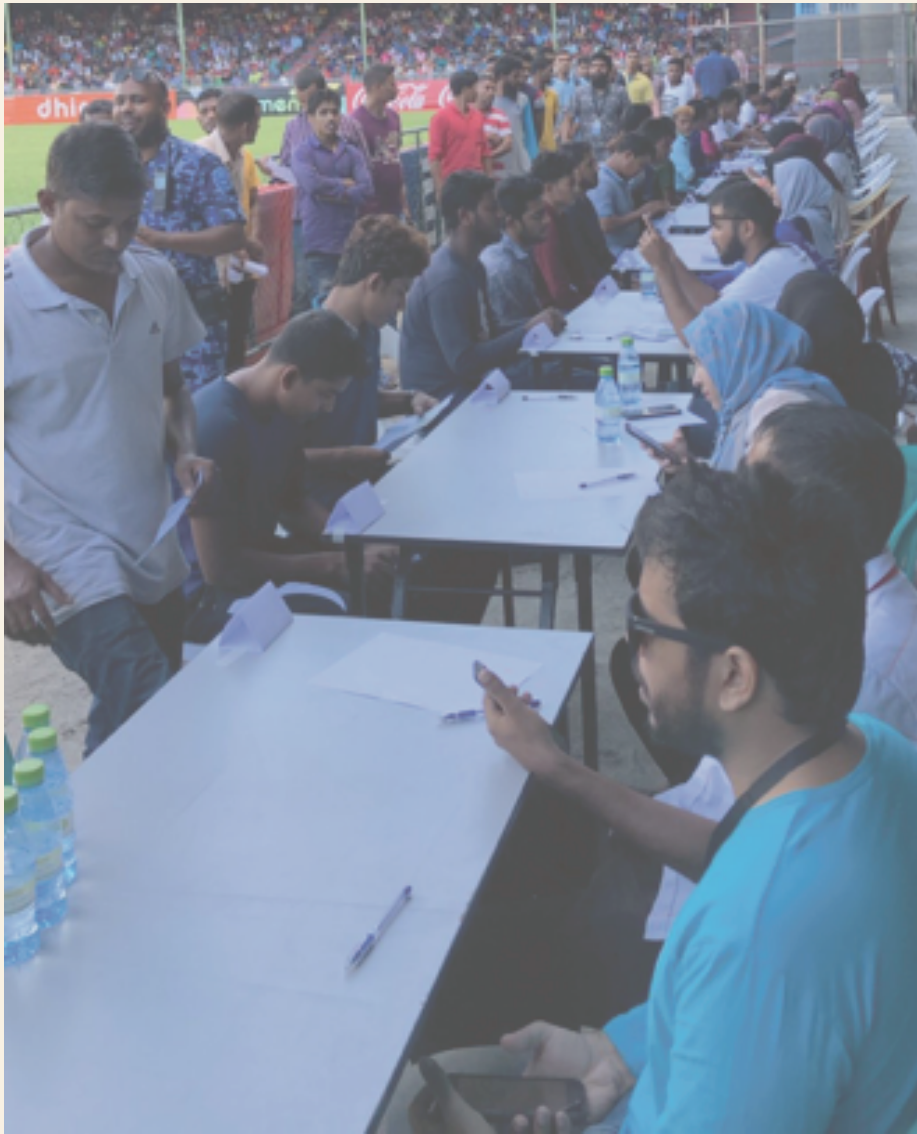
میری انٹر نیشنل ایئر لائنز کی قیادت میں پاکستان کی حکومت

● قومی سطح پر ہائیڈروجن ایئر لائنز کی قیادت میں