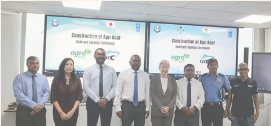
මෙහිදී ප්‍රධාන වශයෙන්ම ආනයන සහ අපනයන සම්බන්ධව ප්‍රවේශීය ක්‍රමවේදයක් සාක්ෂි දීමට මෙහි අරමුණ වේ.

◆ මෙහිදී ප්‍රධාන වශයෙන්ම ආනයන සහ අපනයන සම්බන්ධව ප්‍රවේශීය ක්‍රමවේදයක් සාක්ෂි දීමට මෙහි අරමුණ වේ.