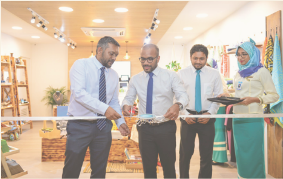
ایک ایسی سرگرمی جو ادارے کی مقاصد کو پورا کرنے میں مددگار ہو۔

● ادارے کی سرگرمیاں: ایسی سرگرمیاں جو ادارے کی مقاصد کو پورا کرنے میں مددگار ہوں۔